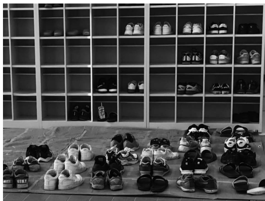
写真1.会場入口付近にブルーシートを敷き外履きシューズを置かせて会場内の非測定者の人数把握