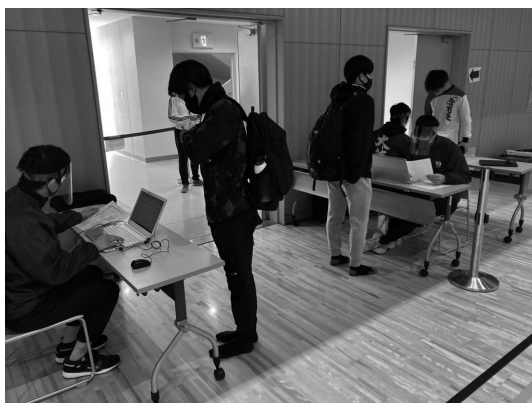
写真6. 会場出口でのデータ照合

測定後は、測定結果記入用紙に測定員が記入した内容を被測定者がスマホを使ってGoogleフォームに入力して送信した。会場出口にて送信データと測定結果用紙とのデータ照合を行い、入力ミスなどなければ学生を退出させた（写真6）。2021年度は、Googleフォームおよびスプレッドシートを活用して、データ入力、データ照合、処理などを行うことで、スタッフ数の削減や測定後のデータ入力が簡素化された。